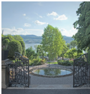
Ziergarten nach der Instandstellung