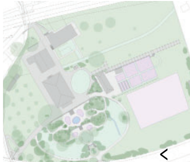
Restaurierte Zier- und Gemüsegärten, Konzept Stallneubau