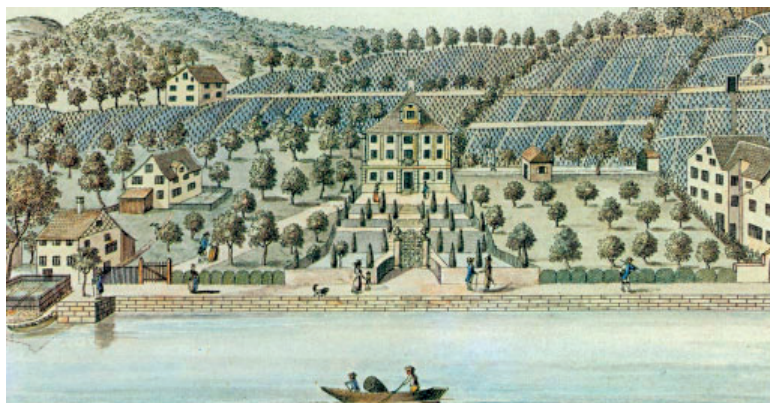
Ansicht vom See 1794 von Heinrich Bruppacher (ZB Zürich, Graphische Sammlung)