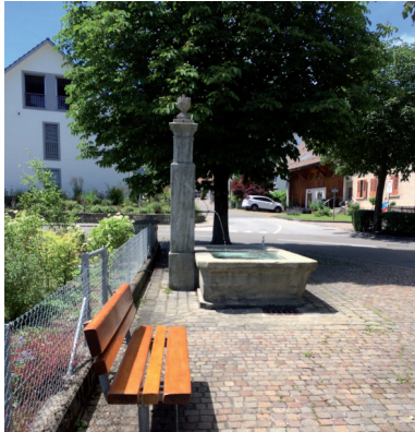
Anschluss an den alten Dorfkern